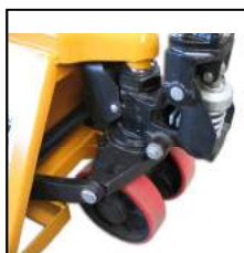
Wartungsarme, Hydraulikpumpe mit externem Tank