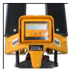
Solides Mehrstasten-Display mit Abdeckung