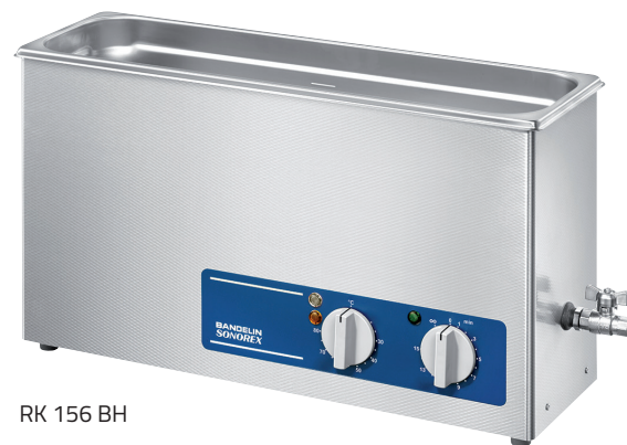
RK 156 BH

Cuves à ultrasons de haute puissance pour le nettoyage ou le traitement des échantillons dans solutions aqueuses